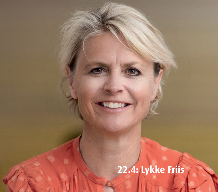
22.4: Lykke Friis

Undervejs får vi blandt andet besøg af Lykke Friis, der er direktør for Tænketanken Europa. Kursusleder: Casper Dalboe