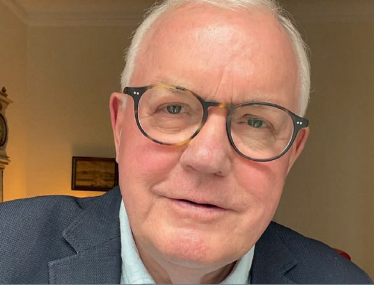
Politisk kommentator Hans Engell holder foredrag om dansk politik på hold 28