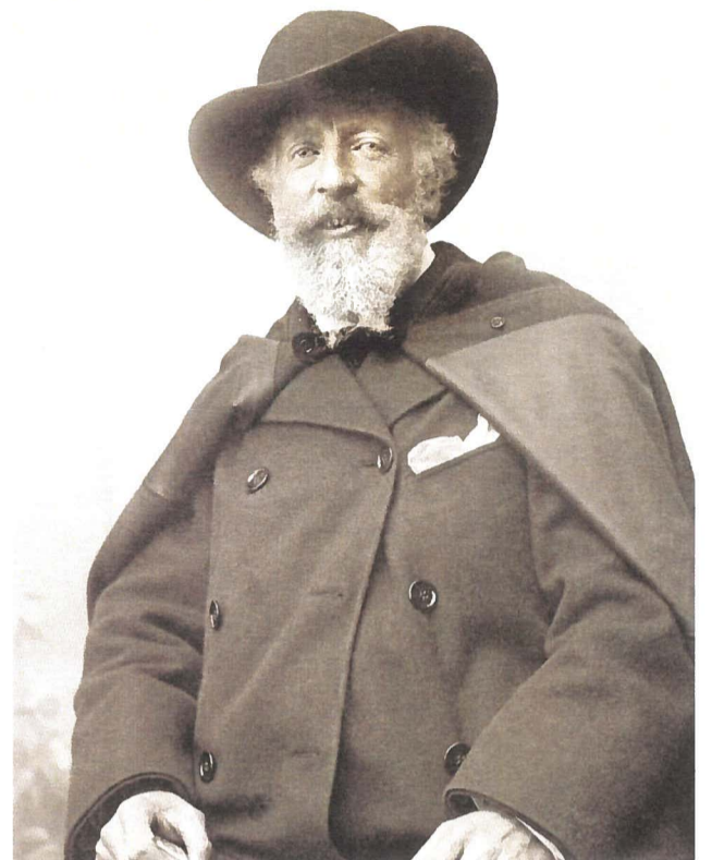
▲ Højskolen Marielyst skal være refugium for kunstnere. I begyndelsen af 1900-tallet var den firlængede gård et badehotel, som Holger Drachmann (foto til højre) besøgte i sommeren 1906.

Badehotellet Marielyst! Østersøbad, Pragtfuld Strand og grønne Enge, Dejligt Bad og bløde Senge; Skygge i en gammel Have, Frue, som kan god Mad lave. Holder Værten, hvad han lover, Hurra! Livets Haab og Trøst — Hurra! Østersøens Vover — Falsters Fryd, Marielyst! Den 28. Juli 1906. Holger Drachmann.